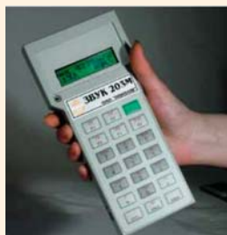
Рис. 1. Прибор «Звук-203М»